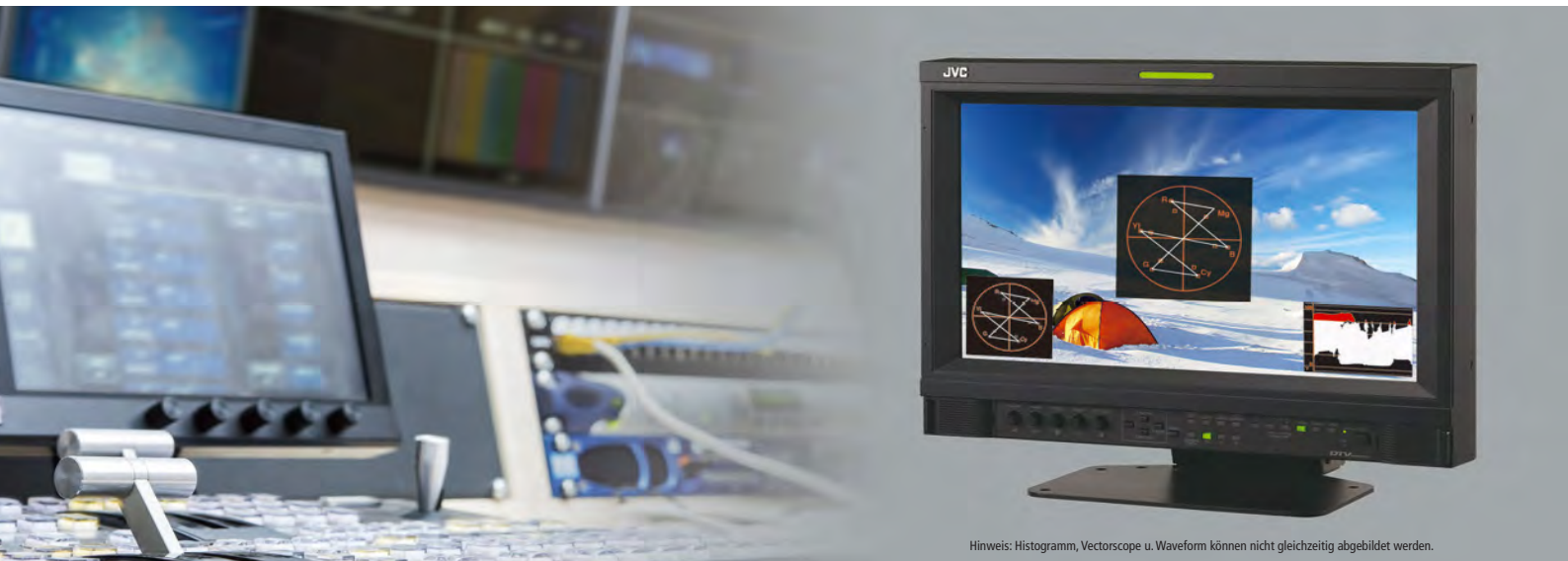
Hinweis: Histogramm, Vectorscope u. Waveform können nicht gleichzeitig abgebildet werden.

JVCs DT-V17G2 eignet sich ideal für Feld-, Studio- und Broadcast-Bildauswertungen. Sein 10-Bit-Panel und der weite Gamma-Bereich machen ihn zum idealen Monitor für die kritische Bildauswertung.